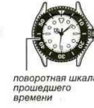
поворотная шкала прошедшего времени