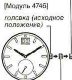
[Модуль 4746] головка (исходное положение) первый щелчок (выставление числа)