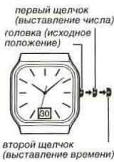
первый щелчок (выставление числа) головка (исходное положение) второй щелчок (выставление времени)