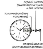
первый щелчок (выставление числа и дня недели) головка (исходное положение) второй щелчок (выставление времени)