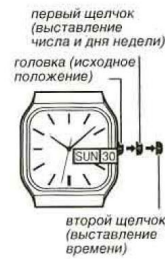
первый щелчок (выставление числа и дня недели) головка (исходное положение) второй щелчок (выставление времени)