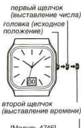
головка (исходное положение)