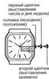
первый щелчок (выставление числа и дня недели)