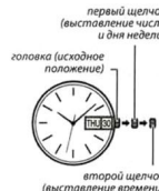
первый щелчок (выставление числа и дня недели)