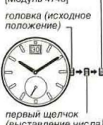
первый щелчок (выставление числа)