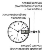
второй щелчок (выставление времени)