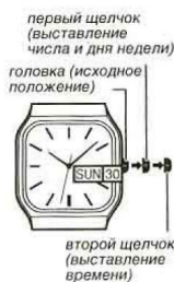
второй щелчок (выставление времени)