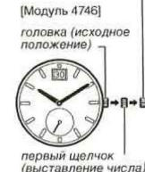
первый щелчок (выставление числа)