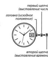
второй щелчок (выставление времени)