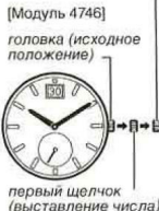
первый щелчок (выставление числа)